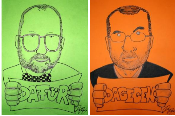
Ex-Dekane-Karikaturen eines Studenten